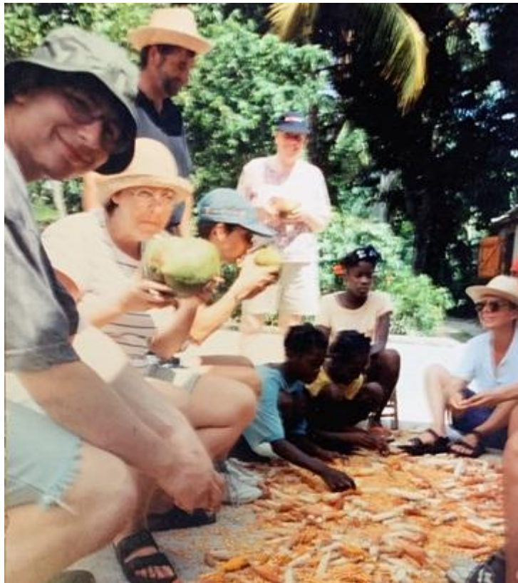
On goûte l'eau de coco pendant l'égrenage du maïs.

Elle dit de ses dix années sous le voile qu'elles ont illuminé sa vie. Et cela en dépit de toutes les frustrations, déceptions et tensions qui ont ponctué sa mission. «Ma vie religieuse a été un enrichissement exceptionnel.» Pendant son noviciat à Paris, elle a fréquenté deux «saints», un père aumônier qui l'a encouragée à lire l'histoire de l'Église et lui a fait apprendre le chant grégorien ainsi qu'une supérieure bretonne. Tous deux auront su étancher sa soif d'apprendre.