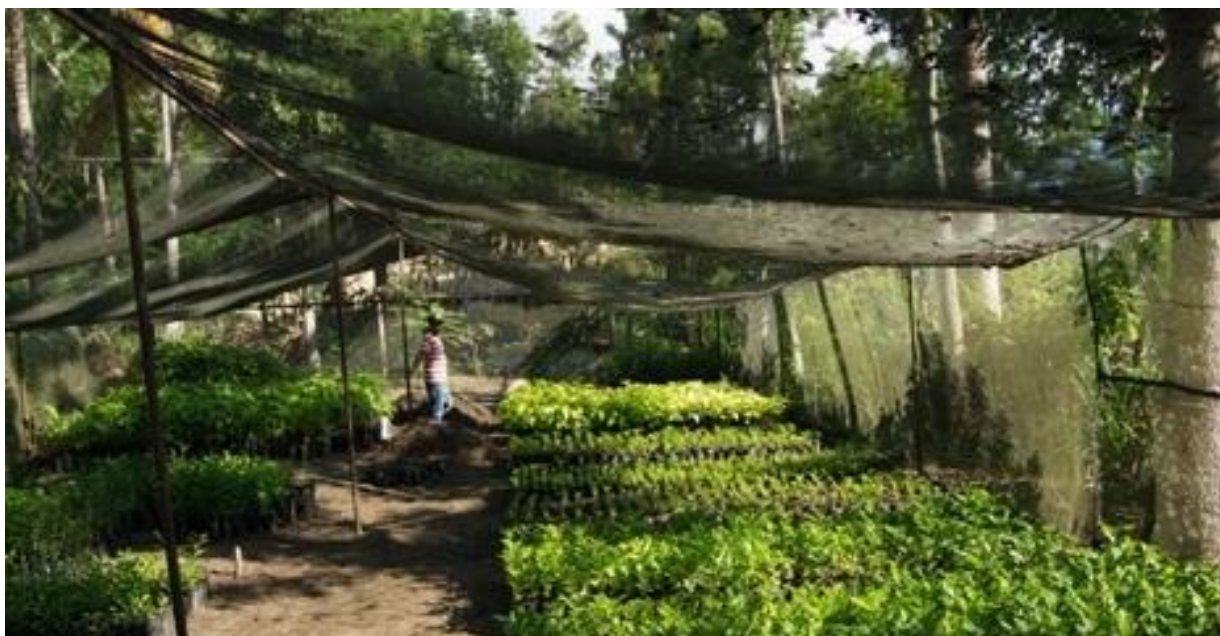
Une nouvelle pépinière pour la plantation d'arbres et de plantules de café.

L'AQANU-Granby continue d'offrir le café haïtien nOula parce que chaque tasse contribue à améliorer les conditions de vie des familles productrices, à rendre plus solides les coopératives et à renforcer la dignité de ses partenaires.