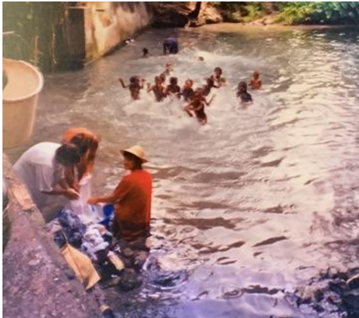
L'AQANU avait soutenu un projet de captage d'une source d'eau.