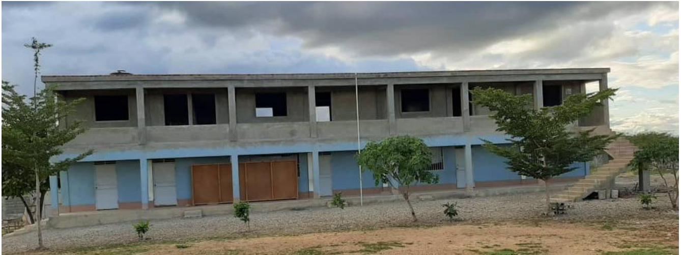
La nouvelle école en construction à la ferme de Fort Liberté.