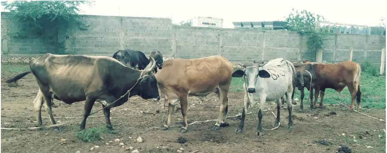
L'élevage du bœuf fait également partie de l'éventail des activités agricoles.

Le système ne nécessite pas d'investissements importants. Au total, AQANU-Granby offre une contribution d'un peu plus de 5000 $ pour un projet qui en nécessite quelque 10 000 $. Les PSST devront financer la main-d'œuvre et ce qu'il faut pour approvisionner le système en électricité (génératrice et panneau solaire).