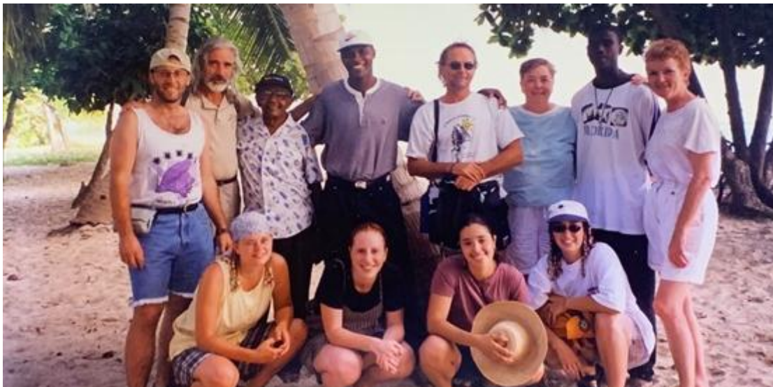
Le groupe de stagiaires à Torbeck en 1998.

Son premier séjour en Haïti en 1987 a failli virer au cauchemar. À Torbeck où elle se trouvait, elle chute d'une hauteur de 15 pieds, le plancher s'étant effondré sous elle. Ayant décidé de la guérir, un «ramancheur» haïtien la traite. «Ce «rolfing» a été une expérience douloureuse, mais au bout d'une semaine, j'étais sur pied. Tous les matins, les gens du village s'installaient sous le perron et me transmettaient leur énergie.»