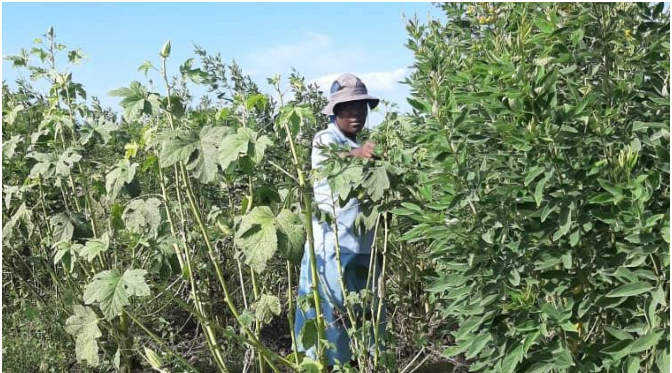
La ferme élève et cultive.

Le système ne nécessite pas d'investissements importants. Au total, AQANU-Granby offre une contribution d'un peu plus de 5000 $ pour un projet qui en nécessite quelque 10 000 $. Les PSST devront financer la main-d'œuvre et ce qu'il faut pour approvisionner le système en électricité (génératrice et panneau solaire).