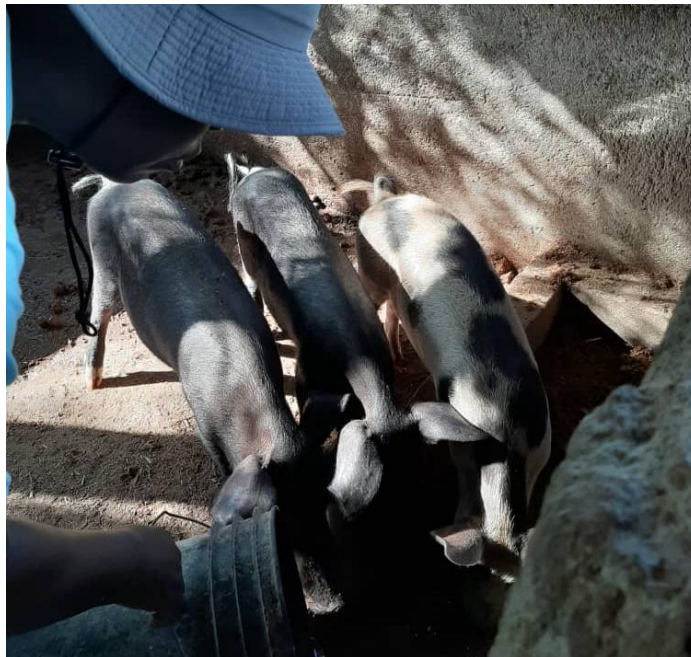
La ferme-école mise entre autres sur l'élevage du porc.

Il poursuit en disant que si l'expérience est concluante, elle pourrait se multiplier à d'autres organisations paysannes qui pourraient, à la fois produire du poisson (du tilapia en l'occurrence) et cultiver tomates, fraises ou haricots. «Et il ne faut pas oublier que les PSST sont présentes dans dix régions d'Haïti.»