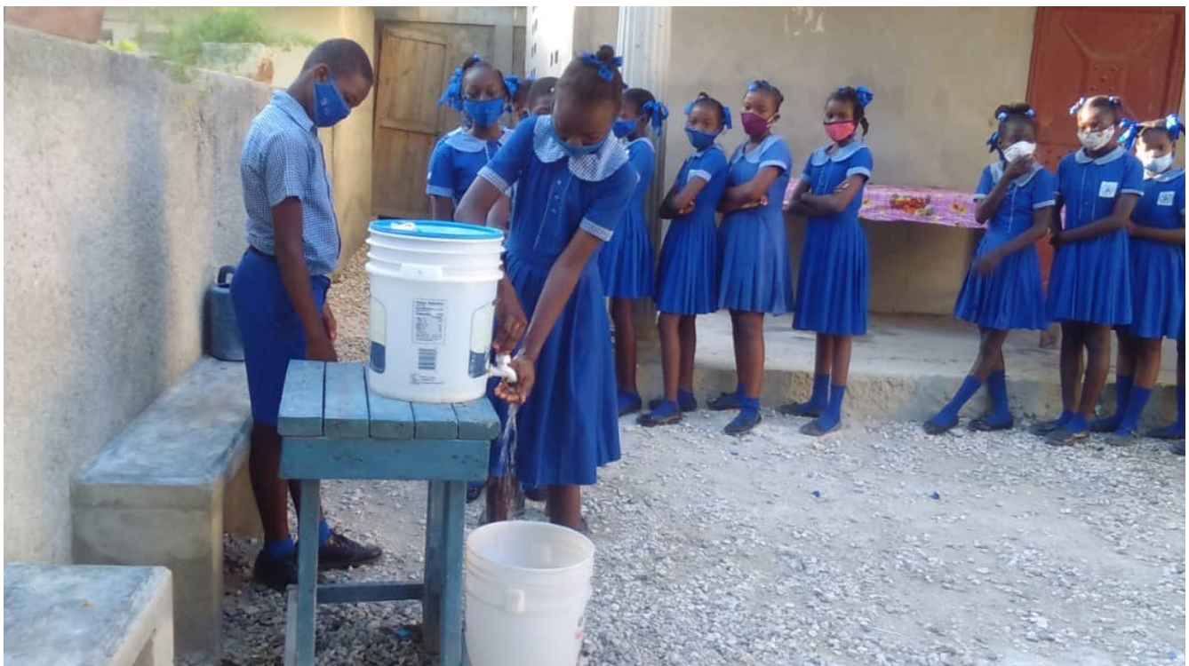
Des étudiantes de l'École de formation professionnelle Mark Gallagher.

Avec la contribution financière de l'AQANU-Outaouais, les Petites sœurs de Sainte-Thérèse (PSST) d'Haïti ont poursuivi leur campagne de sensibilisation et acquis du matériel pour prévenir la propagation de la COVID-19 dans deux de leurs établissements scolaires.