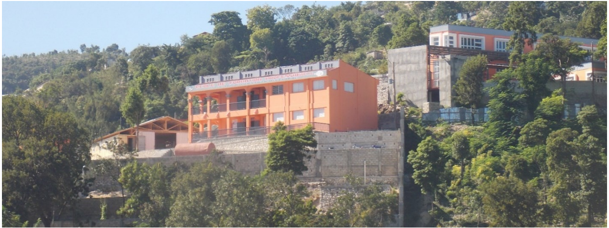
L'École de formation professionnelle Mark Gallagher à Rivière-Froide.