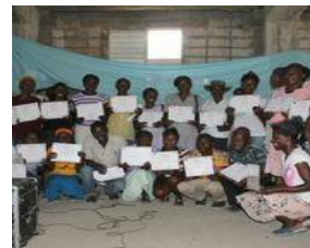
Projet d'alphabétisation à Pilate et Ravine-Trompette.

À la fin des années 70 et au début des années 80, un comité d'action politique a été mis sur pied, avec pour but de prendre position à l'égard des orientations des gouvernements canadien et québécois concernant le développement international. Mais son activité a été limitée.