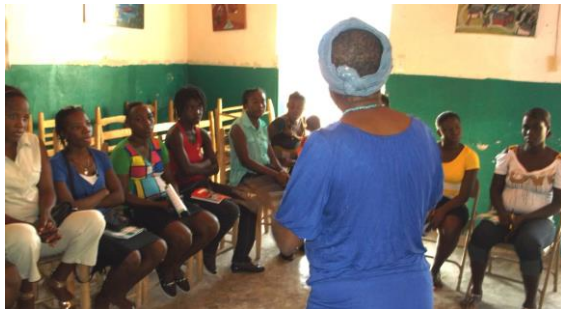
Séance d'information sur le planning familial à Corail

Outre l'ACDI qui a financé plusieurs projets de l'AQANU dans le passé, l'AQANU a bénéficié des fonds de plusieurs organismes pour la réalisation des projets.