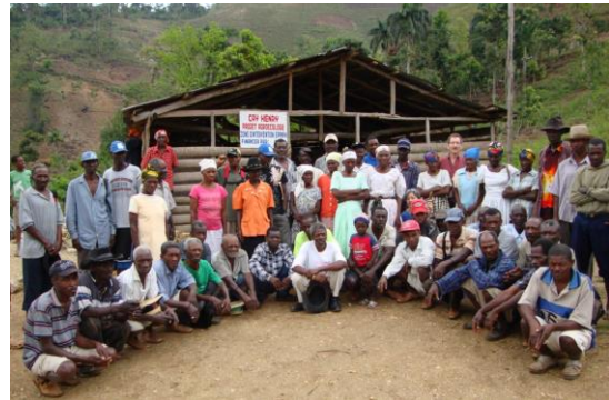
Membres d'un groupe de paysans participant à un projet de jardins écologiques à Rivière Froide.

La sécurité alimentaire s'est rapidement imposée comme un dossier majeur pour l'AQANU qui a soutenu une série de projets agricoles dans diverses régions visant à améliorer le sort des paysans. Ces projets portaient notamment sur la protection des sols et la formation des agriculteurs afin qu'ils puissent produire davantage sur leur lopin de terre.