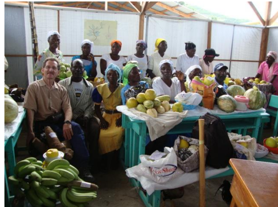
Exposition des produits des jardins à Rivière Froide

Au début les projets portaient sur de petits montants, mais ceux-ci ont augmenté au fil des années : de 10 000 dollars à 30 000, puis 50 000, 100 000 et au-delà.